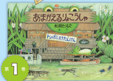
第1巻 「あまがえるりょこうしゃ トンボいけたんけん」