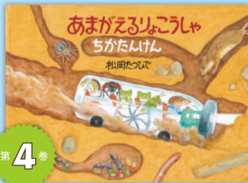
第4巻 「あまがえるりょこうしゃ ちかたんけん」