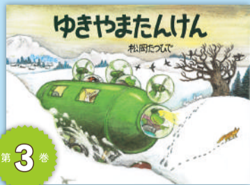
第3巻 「ゆきやまたんけん あまがえるりょこうしゃ」