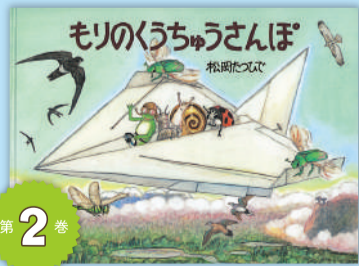
第2巻 「もりのくうちゅうさんぽ あまがえるりょこうしゃ」